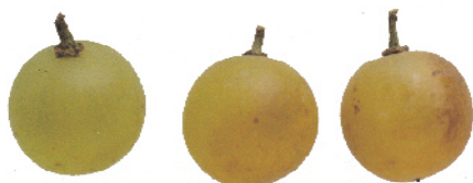
Bayas en maduración.