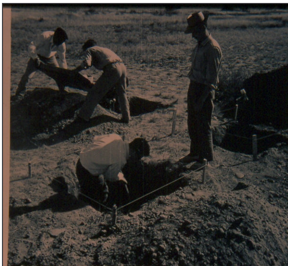
Figura 3. Excavaciones en el valle de Uspallata (gentileza de J.Schobinger).

insertados en este trabajo pero razones de alcance laboral nos lo imposibilitan por el momento 5 .