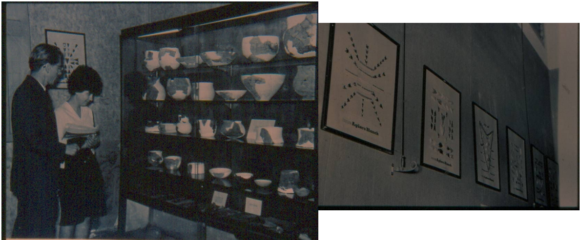
Figura 6. Instalaciones y montaje de exposiciones en el Museo del Instituto de Arqueología y Etnografía de la Facultad de Filosofía y Letras.

Actualmente se ha constituido una entidad encargada de dar tratamiento directo a la problemática arqueológica y hacer las veces de organización asesora del Comité Provincial de Patrimonio Cultural. Hablamos del "Consejo Provincial de Arqueólogos" del cual el autor ha participado en sus reuniones constitutivas. Este Comité será una instancia superadora en lo que a protección de patrimonio, difusión social e intercambio de experiencias profesionales en la especialidad se refiere. Cuenta con investigadores de toda la provincia, por lo que se ha constituido en un nexo fundamental entre los arqueólogos del norte y el sur de la provincia.