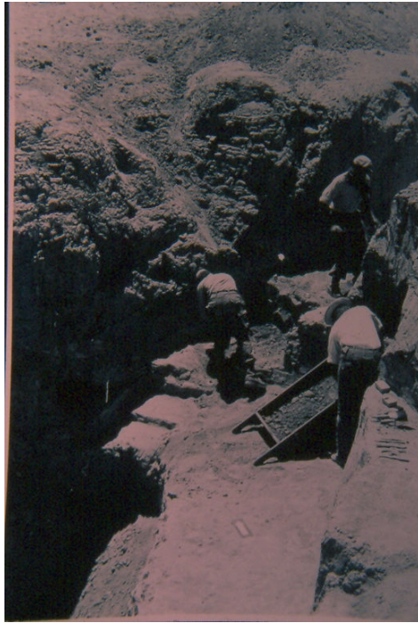
Figura 5. Excavaciones en el valle de Uspallata

tipologizaciones artefactuales morfológicas excluyentes y sesgadas, que relacionan, por categorizaciones de tipo formal y apriorísticas: puntas de proyectil, perforadores y tipos cerámicos -por caracterización decorativa-, acríticas que redundan en planteos "circulares" o normativos.