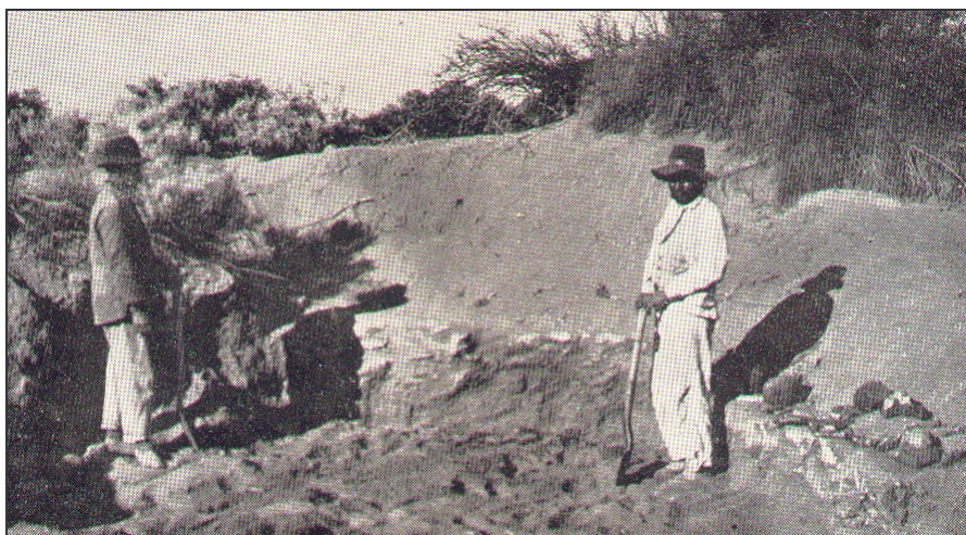
Figura 1. XXIª expedición del Museo etnográfico liderada por Debenedetti a Lagunas de Guanacache (Vignati 1953).

Pudimos comprobar que para el 43% de la muestra estas resultaban "intimidatorias" y llevó a que se negaran a realizar la totalidad de la encuesta, algunos directamente y otros indirectamente, dando a entender que su decisión era la de dar largas al asunto por no ser de su comodidad referirse en definitiva a la totalidad del cuestionario. Los rechazos tuvieron de todas maneras justificación explícita y planteos de solución alternativa al propio autor. Este rechazo nos obligó a reorientar el modelo inicial de trabajo, y decidimos no dar tratamiento a ciertos datos obtenidos en la encuesta oral, por respeto a quienes dieron su opinión y quedarían evidenciados de planteos e ideas muy personales que de otro modo habrían sido tratadas estadísticamente en un conjunto despersonalizado de actores.