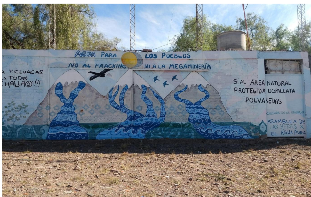
Murales en la rotonda del challao reclamando agua potable y cloacas