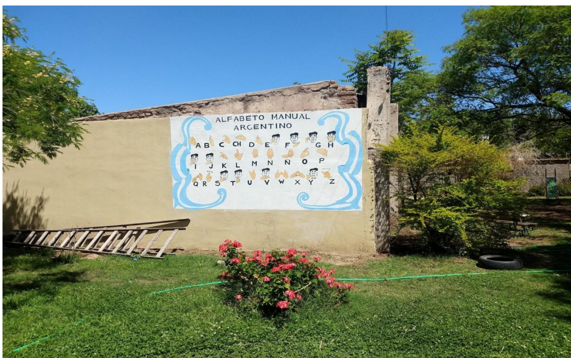
Apenas se ingresa al Cebja Pedernera se encuentra pintado el alfabeto argentino de lengua de señas.