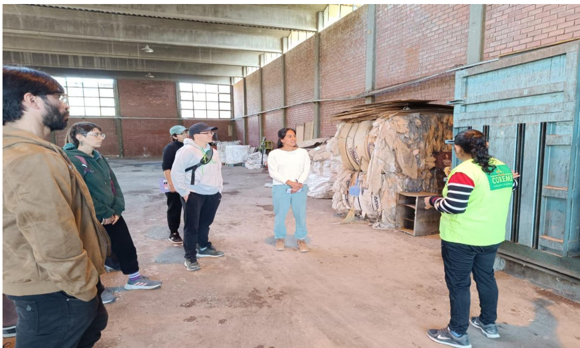
Visita cooperativa Coreme