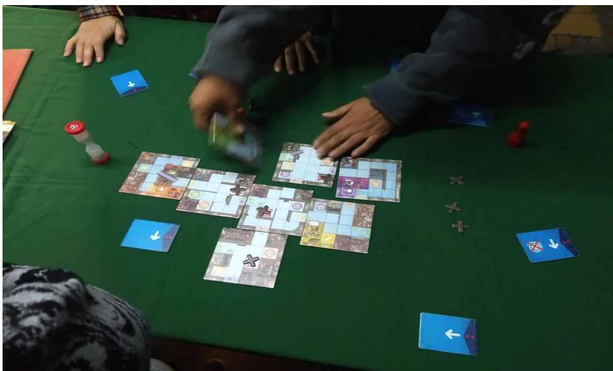
Juegos de mesa utilizados durante el taller “juegos lúdicos”