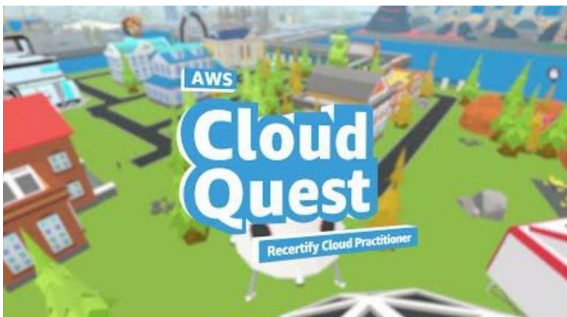
Figura 12 – Juego AWS Cloud Quest