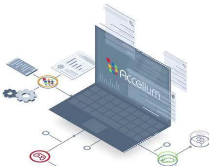
Figura 13 – Imagen ilustrativa de la plataforma Accelium