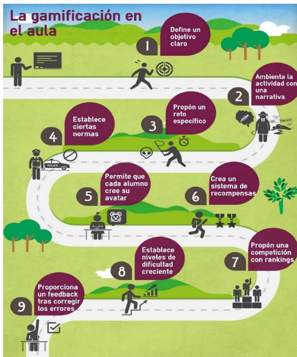
Figura 3 - Pasos de la gamificación en el aula