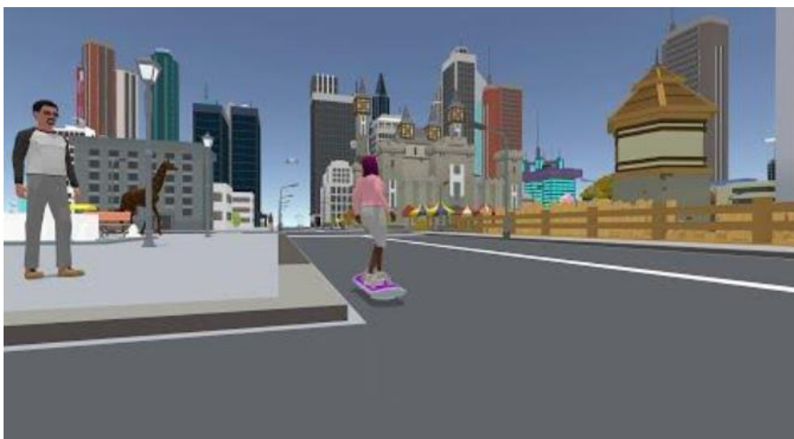
Figura 10 – Juego AWS Cloud Quest