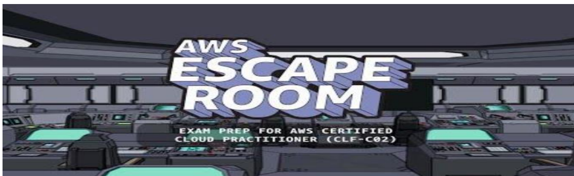
Figura 11 – Juego AWS Escape Room