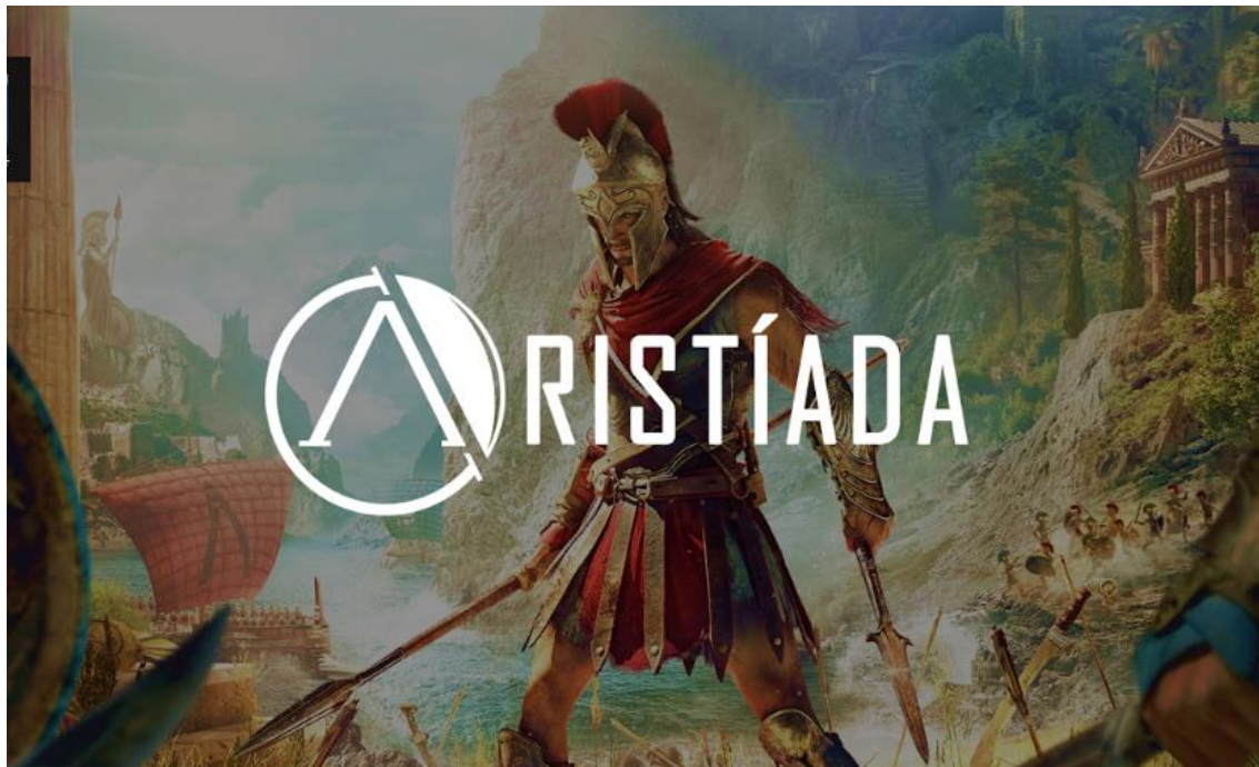
Figura 14 – Imagen ilustrativa del juego Aristiada