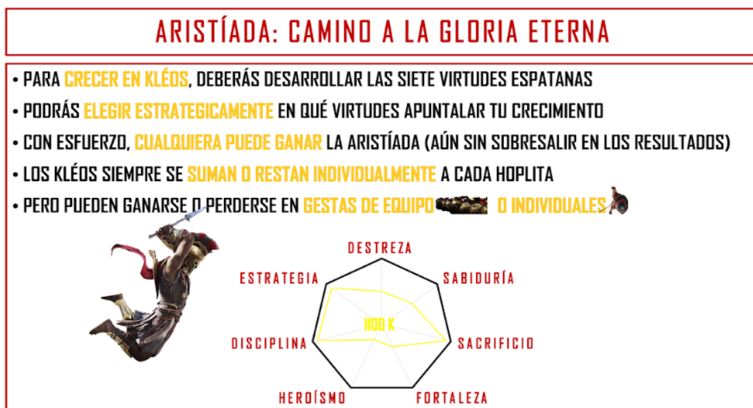
Figura 15 – Parte de los componentes del juego Aristíada