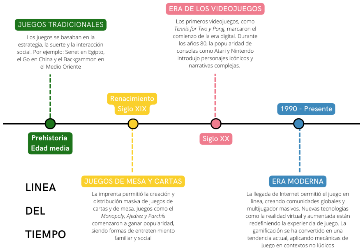
Figura 1- Evolución del Juego en la historia