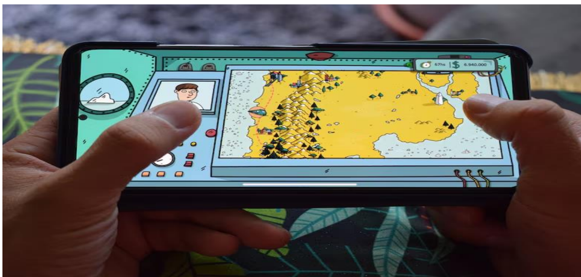
Figura 5 - Juego de Nawaiian