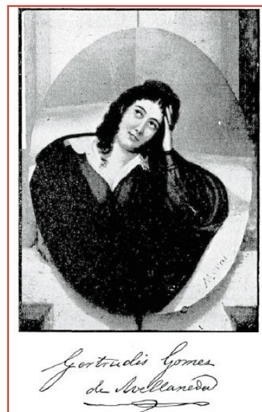
Litografía realizada en Cádiz en 1838 por Del Moral. Apareció publicada por primera vez en 1914 en Memorias inéditas de la Avellaneda, obra que recopilara Domingo Figuerola Caneda.

En ambos casos su referencia directa no es el mar (¿podría serlo puro y sin reminiscencias?), sino las lecturas que se interponen entre él y su escritura. Para una subjetividad cuya vislumbre del mundo exterior se percibe a través de los puntos de fuga que propician los libros, no parecen ser requerimientos forzados las correspondencias entre lo figurado por una imaginación fervorosa y una realidad casi siempre