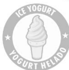
ESCALA DE GRISES 30%