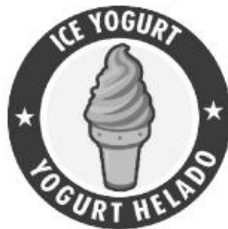
ESCALA DE GRISES 100%

Para aplicaciones monocromáticas, ya sea negro o algún color institucional, el porcentaje de la tinta será de 100% o con transparencia al 20%. Para la marca de agua y escala de grises se usará al 30%.