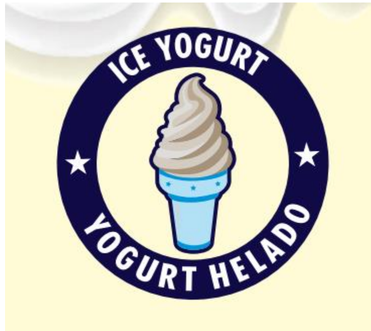
Gráfico N° 1: Marca de la empresa

Marca: La marca es el signo que distingue en el mercado los productos de una empresa. Es un signo distintivo y su función es diferenciar en el mercado un producto frente a los de los competidores.