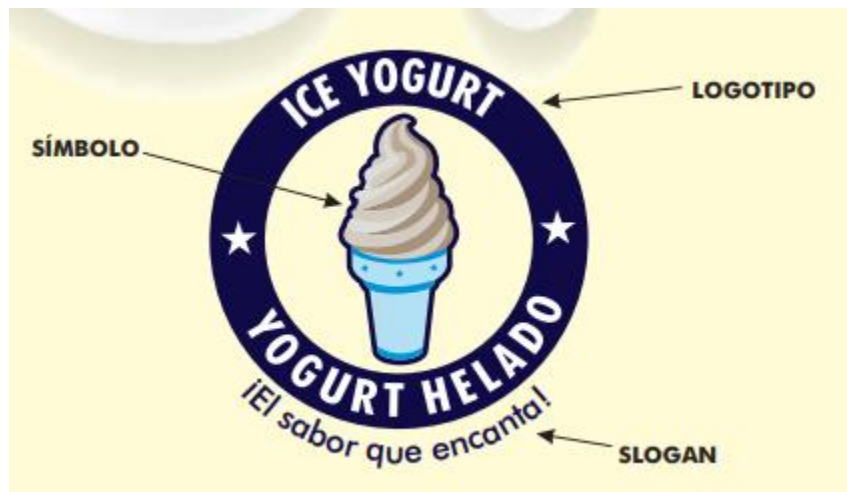
Gráfico Nº 2: Isologo de la empresa

Los colores empleados en la gama de los azules y celestes se asocian con salud, seriedad y frescura. También se utilizaron colores pasteles claros haciendo mención a los sabores que ofrecemos. Generando, un conjunto de armonía en la composición.