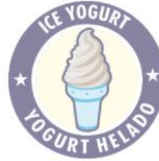
MARCA DE AGUA 30%