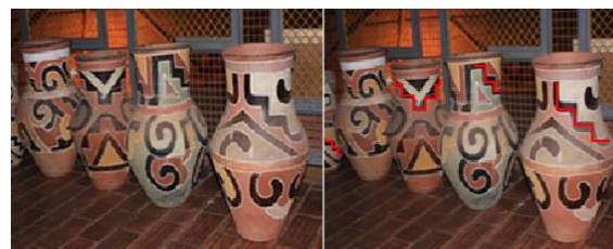
Figura 1 - Presença de possíveis formas do símbolo da Chakana na cerâmica Kadiwéu. No lado esquerdo, foto da cerâmica Kadiwéu do Blog do Memorial da Cultura Indígena, Aldeia Marçal de Souza. Disponível em:

Padilha (1996) e Ribeiro (1950), principalmente em relação a sua cerâmica e escultura. Um exemplo desta cerâmica é apresentado na Figura 1 a continuação.