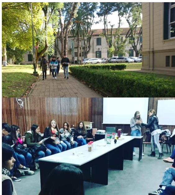
Fig. 4 Actividad Un día en la Universidad desarrollada en la Facultad de Ciencias Exactas (UNLP) con la escuela Escuela de Brandsen, provincia de Buenos Aires.

cercana del Comedor Universitario. Finalmente, los asistentes son invitados a participar un taller teórico-práctico de microscopía, donde se abordan conceptos básicos de biología y bioquímica.