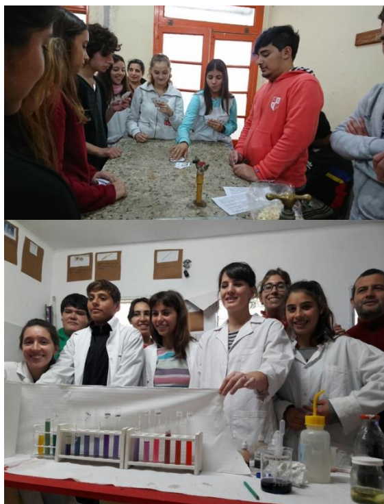
Fig. 2 Talleres de Biomoléculas y pH en las escuelas de Brandsen y Chascomús, provincia de Buenos Aires.

Asimismo, llevamos a cabo talleres en colaboración con los proyectos de extensión de la Facultad de Ciencias Exactas de la UNLP: “Taller de potabilidad de aguas subterráneas” y “Proyecto Kefir un alimento Probiótico a Costo Cero: Desafíos planteados por la experiencia comunitaria” Participan también de nuestro proyecto docentes extensionistas pertenecientes al Laboratorio de Proteínas del Centro de Investigación y Desarrollo en Criotecnología de Alimentos (CIDCA) y al Instituto de Estudios Inmunológicos y Fisiopatológicos (IIFP).