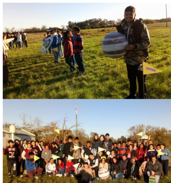
Fig. 3 El sistema solar viviente del taller de astronomía desarrollado en la escuela Escuela del parador El Chajá, provincia de Buenos Aires.

Asimismo, llevamos a cabo talleres en colaboración con los proyectos de extensión de la Facultad de Ciencias Exactas de la UNLP: “Taller de potabilidad de aguas subterráneas” y “Proyecto Kefir un alimento Probiótico a Costo Cero: Desafíos planteados por la experiencia comunitaria” Participan también de nuestro proyecto docentes extensionistas pertenecientes al Laboratorio de Proteínas del Centro de Investigación y Desarrollo en Criotecnología de Alimentos (CIDCA) y al Instituto de Estudios Inmunológicos y Fisiopatológicos (IIFP).