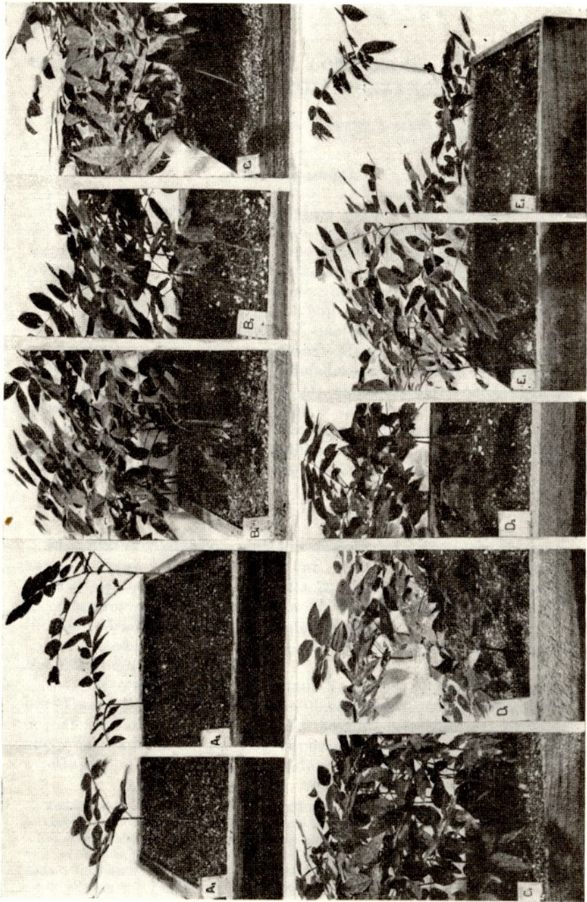
Tratamientos A 1 ; A 2 ; B 1 ; B 2 ; C 1 ; C 2 ; D 1 ; D 2 ; E 1 ; E 2 .