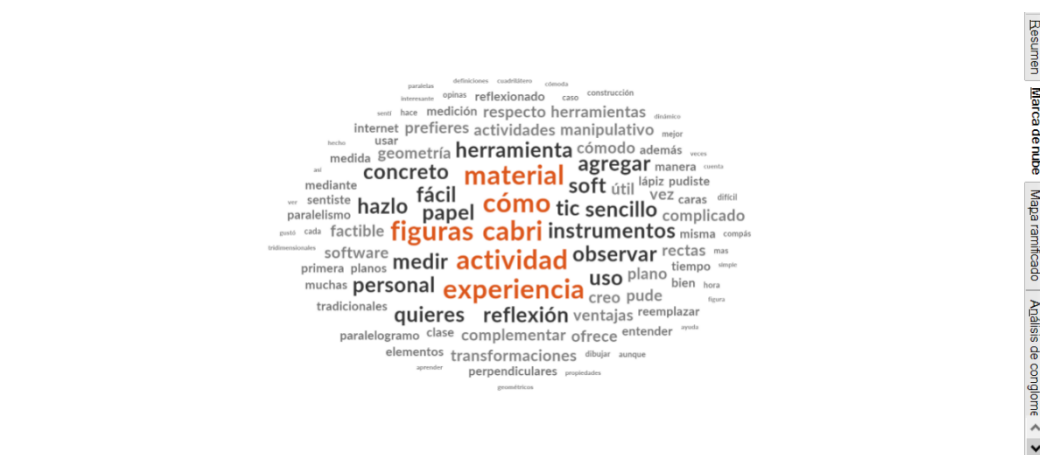
Ilustración 1: Marca de nube de frecuencia de 1000 palabras

La consulta de frecuencia de palabras permite enumerar las palabras que aparecen con mayor repitencia. Se presenta la visualización de la misma a través de la marca de nube: